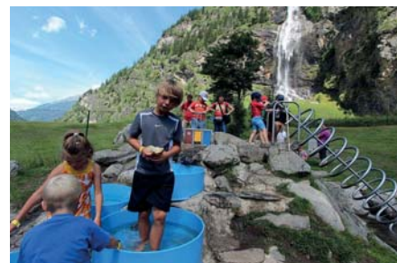
Wasserspielpark Fall- bach