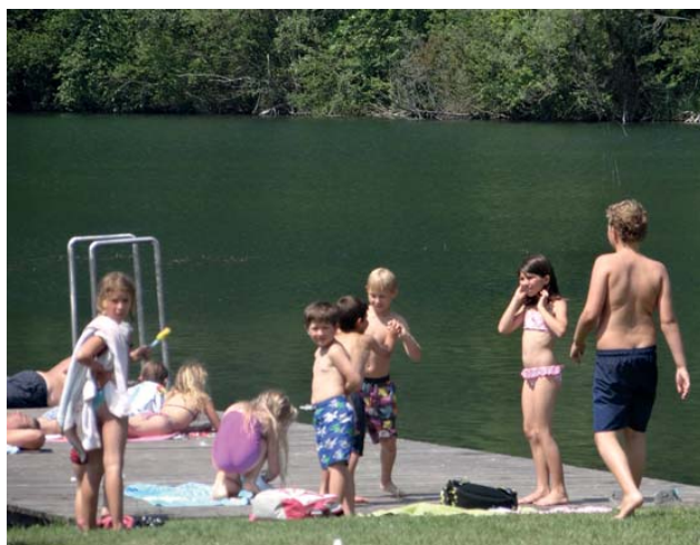
Baden, Baden, baden...