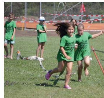
Zivilschutz - Feuer- wehr