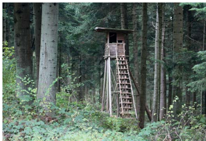
Walderlebnistag Jagd und Natur