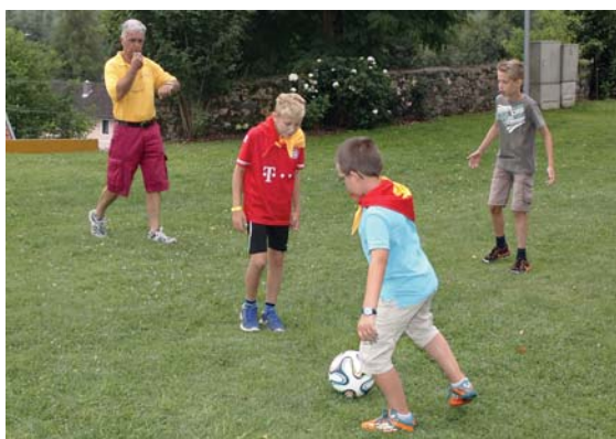
Fußballturnier mit Unterstützung der Cheerleader