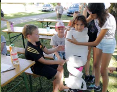
Spiel und Spaß