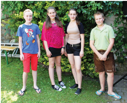
o. Die ersten MUKI- Kinder vor 10 Jahren