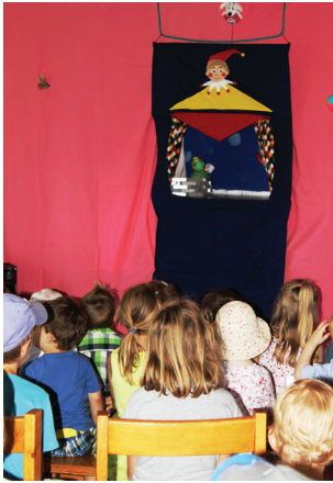
Stauende Kinder beim Kasperltheater, ein Augen- und Ohrenschmaus für Groß und Klein