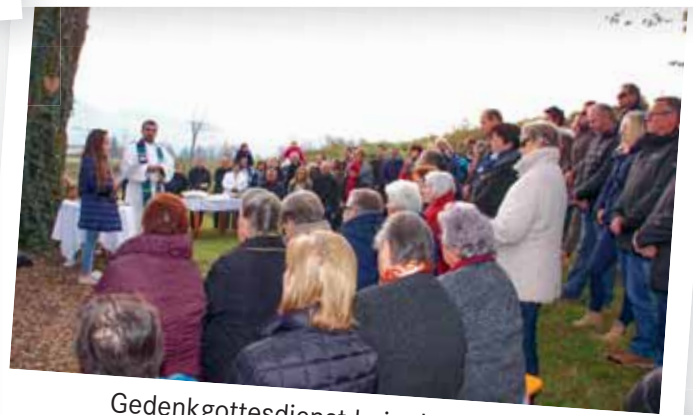
Gedenkgottesdienst beim Ledre Kreuz