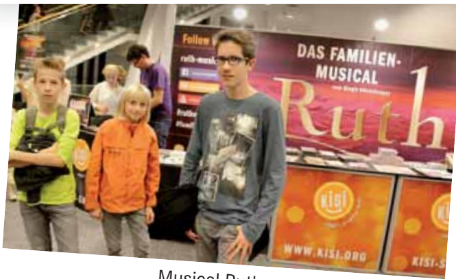
Musical Ruth ...