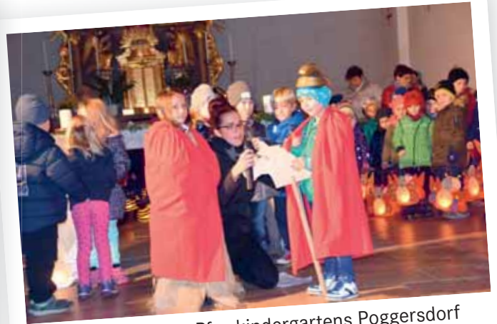
Martinsfest des Pfarrkindergartens Poggersdorf in Dolina