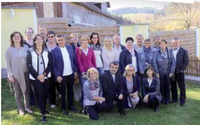
PGR-Klausur Diex – Ein Tag für uns