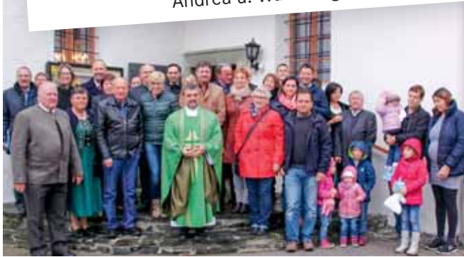
Fest der Jubelpaare Grafenstein