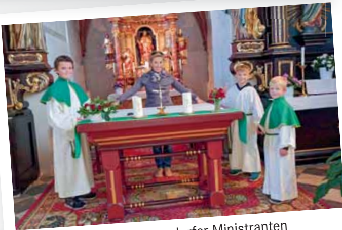
Unsere Poggersdorfer Ministranten