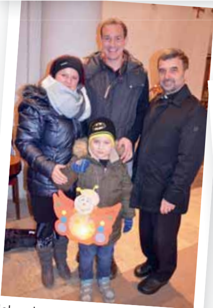
Ich gehe mit meiner Laterne ...