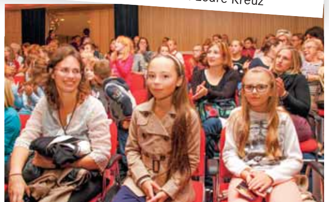
... besuchten unsere ältesten Ministranten