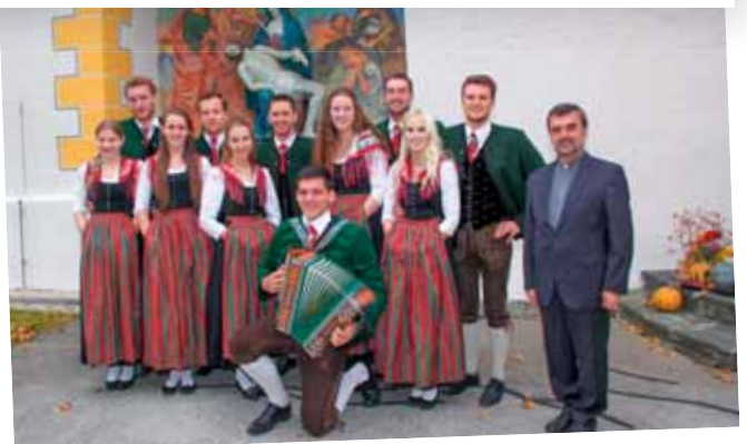
Erntedank 2017 Grafenstein – Die Landjugend tanzte auf