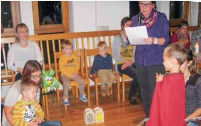
Martinsfest MUKI Runde Poggersdorf