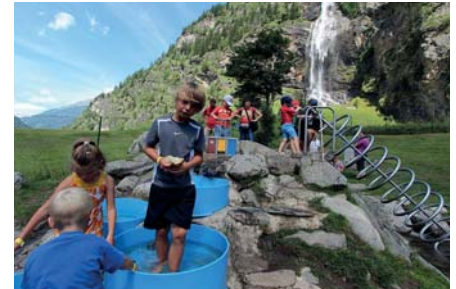
WASSERSPIEL- PARK FALLBACH