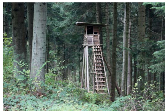
WALDERLEBNISTAG JAGD UND NATUR