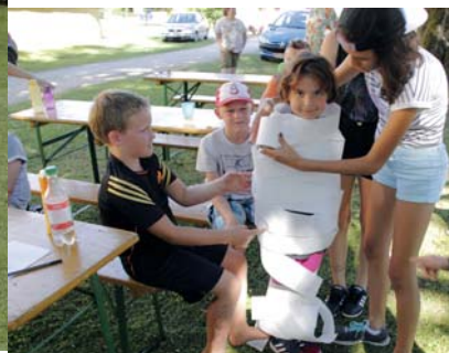
SPIEL UND SPASS