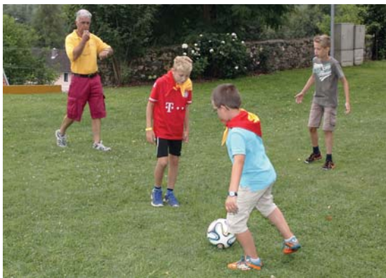
FUSSBALLTURNIER MIT UNTERSTÜTZUNG DER CHEERLEADER