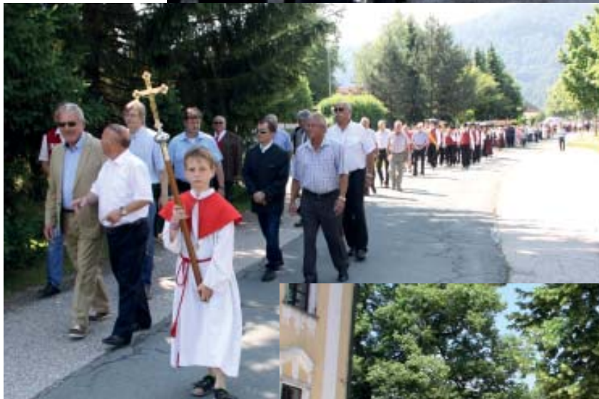
Ein Schattenplatz während der Messe und Umgang war „heiß“ begehrt !!

Wie jedes Jahr wurden alle Gäste kulinarisch bestens versorgt!