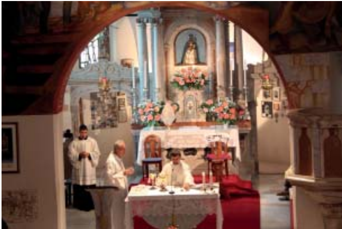
Hl. Messe in der Wallfahrtskirche Luschari