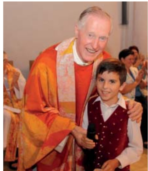
...von Marcel Mischitz: Er hat alleine ein Lied für ihn gesungen