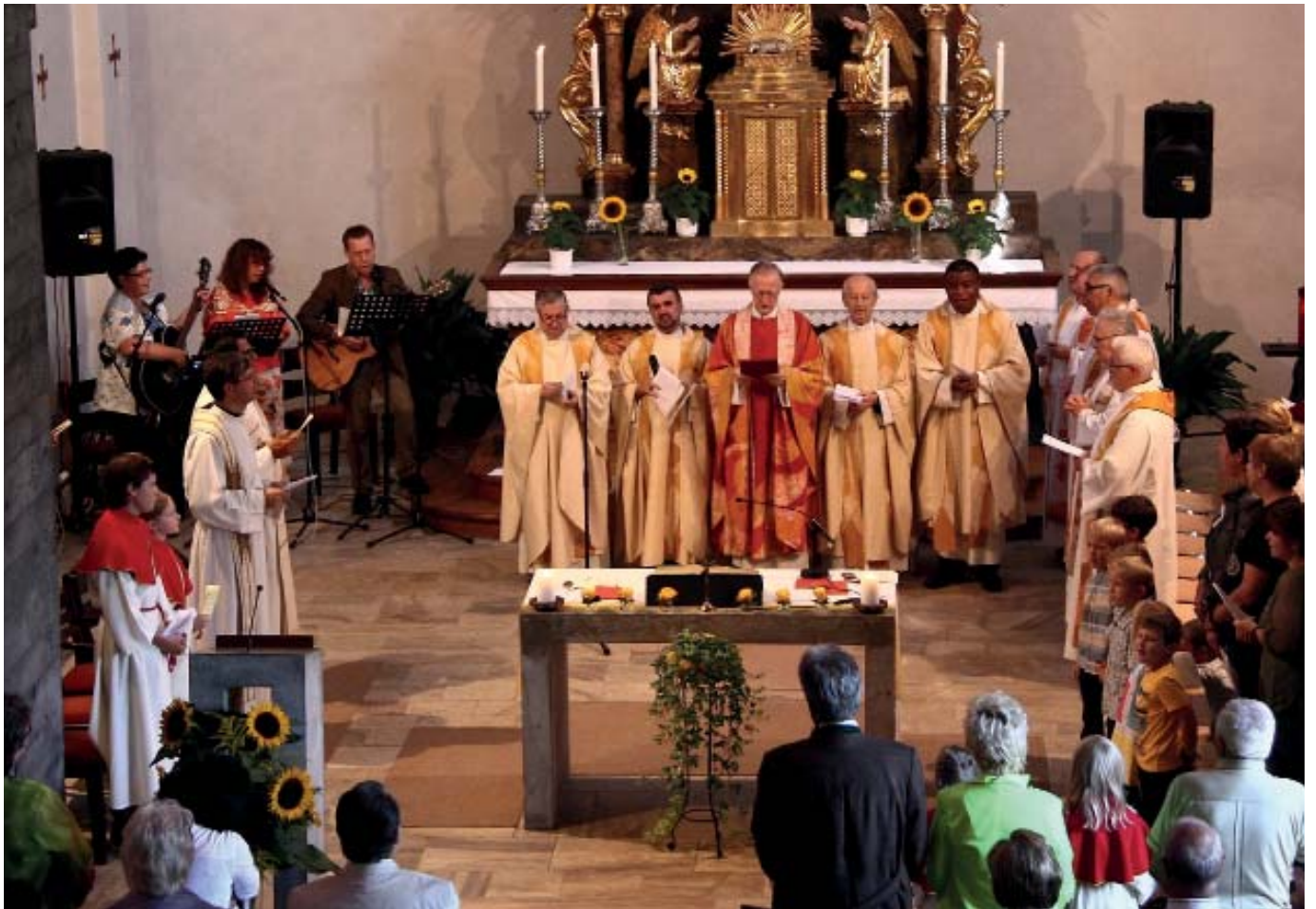
Festgottesdienst in Dolina am 17. August 2015